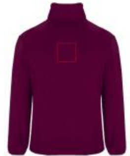
Großflächig auf die Rückseite

• Embroidery fixed 3 (12c) , max. 99x99mm