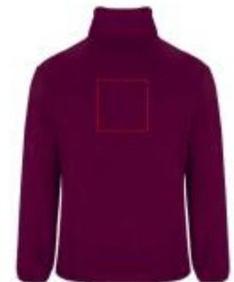
Großflächig auf die Rückseite

• Screenprint B Textile 2 (2c) , max. 150x150mm