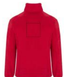
Großflächig auf die Rückseite

• Screenprint B Textile 2 (2c) , max. 150x150mm