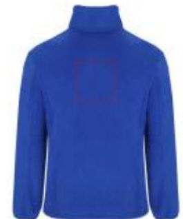
Großflächig auf die Rückseite

• Screenprint B Textile 2 (2c) , max. 150x150mm