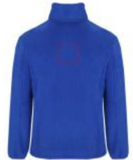
Großflächig auf die Rückseite

• Embroidery fixed 3 (12c) , max. 99x99mm