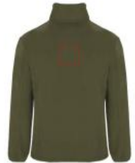
Großflächig auf die Rückseite

• Embroidery fixed 3 (12c) , max. 99x99mm