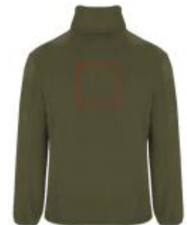
Großflächig auf die Rückseite

• Screenprint B Textile 2 (2c) , max. 150x150mm