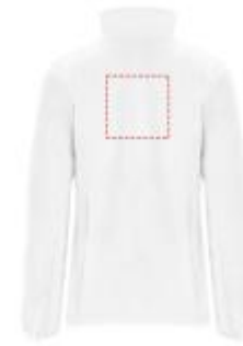
Großflächig auf die Rückseite

• Screenprint B Textile 2 (2c) , max. 150x150mm