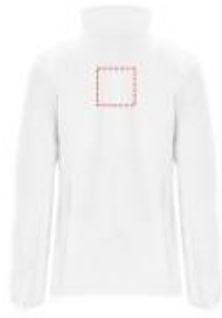
Großflächig auf die Rückseite

• Embroidery fixed 3 (12c) , max. 99x99mm