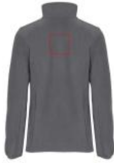
Großflächig auf die Rückseite

• Embroidery fixed 3 (12c) , max. 99x99mm