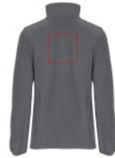
Großflächig auf die Rückseite

• Screenprint B Textile 2 (2c) , max. 150x150mm