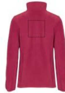
Großflächig auf die Rückseite

• Screenprint B Textile 2 (2c) , max. 150x150mm