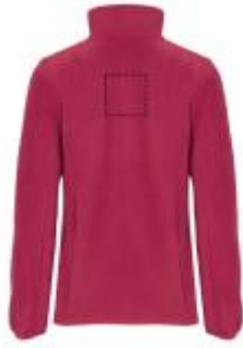
Großflächig auf die Rückseite

• Embroidery fixed 3 (12c) , max. 99x99mm