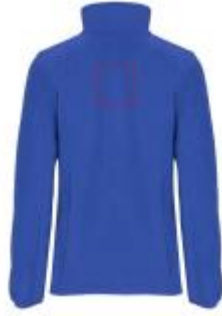
Großflächig auf die Rückseite

• Embroidery fixed 3 (12c) , max. 99x99mm