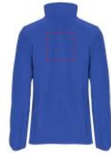
Großflächig auf die Rückseite

• Screenprint B Textile 2 (2c) , max. 150x150mm