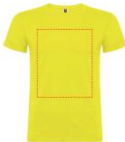
Großflächig auf die Vorderseite