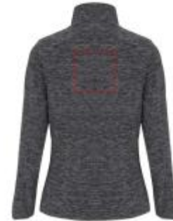
Großflächig auf die Rückseite

• Screenprint B Textile 2 (2c) , max. 150x150mm