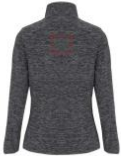
Großflächig auf die Rückseite

• Embroidery fixed 3 (12c) , max. 99x99mm