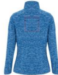
Großflächig auf die Rückseite

• Screenprint B Textile 2 (2c) , max. 150x150mm