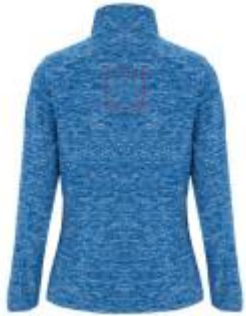
Großflächig auf die Rückseite

• Embroidery fixed 3 (12c) , max. 99x99mm